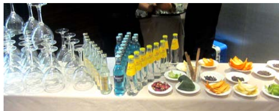
Algunos ingredientes de la cata de Gintonic.

Queremos agradecer la asistencia a todos los que participaron e invitar a próximos eventos a los que no pudieron asistir.