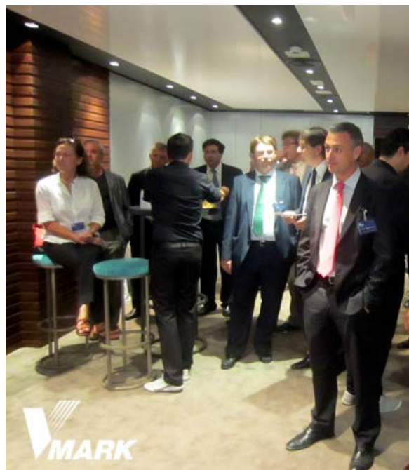
Los asistentes escuchando los tipos de Ginebra y su procedencia

Tiene la documentación del evento en nuestra web: www.vmark.es > Eventos