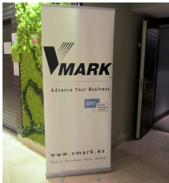
Entrada a la sala de ponencias

Le dejamos las bondades de esta gran iniciativa con la que todos podemos participar de manera activa y con muy poco.